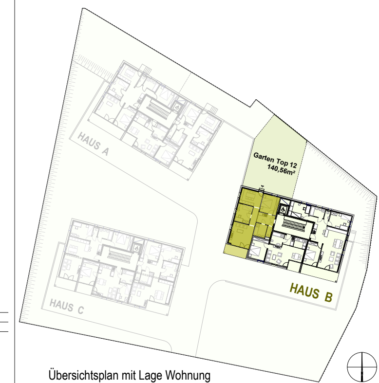
Übersichtsplan mit Lage Wohnung