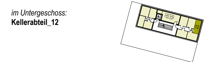
im Untergeschoss: Kellerabteil_12