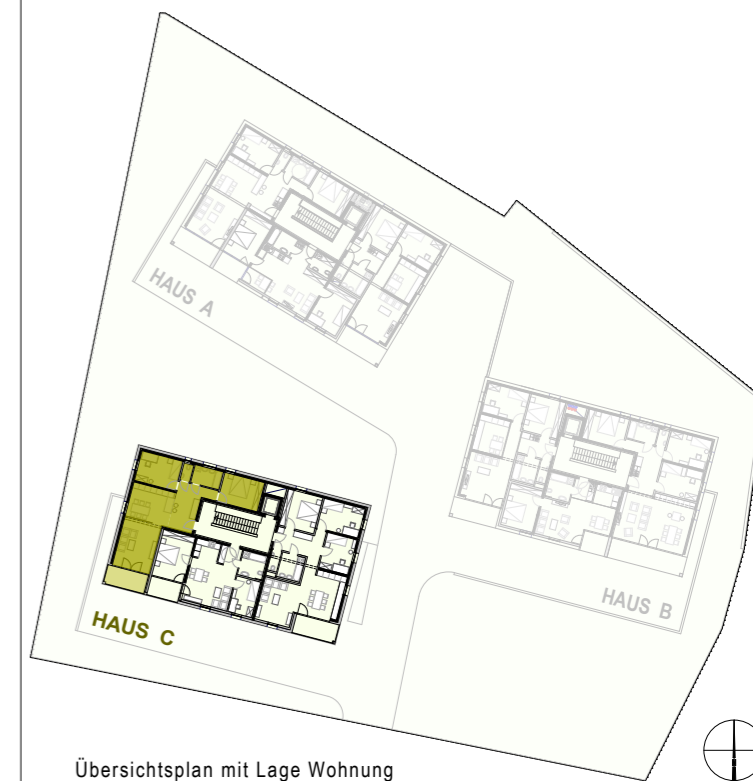
Übersichtsplan mit Lage Wohnung